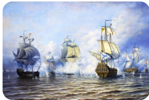
«Бой у острова Эзель 24 мая 1719 года» Алексей Боголюбов (1866–1872)