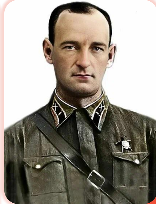
ИВАН АНДРЕЕВИЧ ФЛЕРОВ (1905–1941)

В городе Грязи создан уникальный парк имени Флерова. Многие улицы городов Российской Федерации носят имя Ивана Андреевича Флерова. На малой родине с 1975 г. действует дом-музей И. А. Флерова.